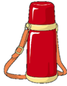
水分補給できるもの