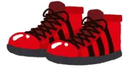
バスケットシューズ